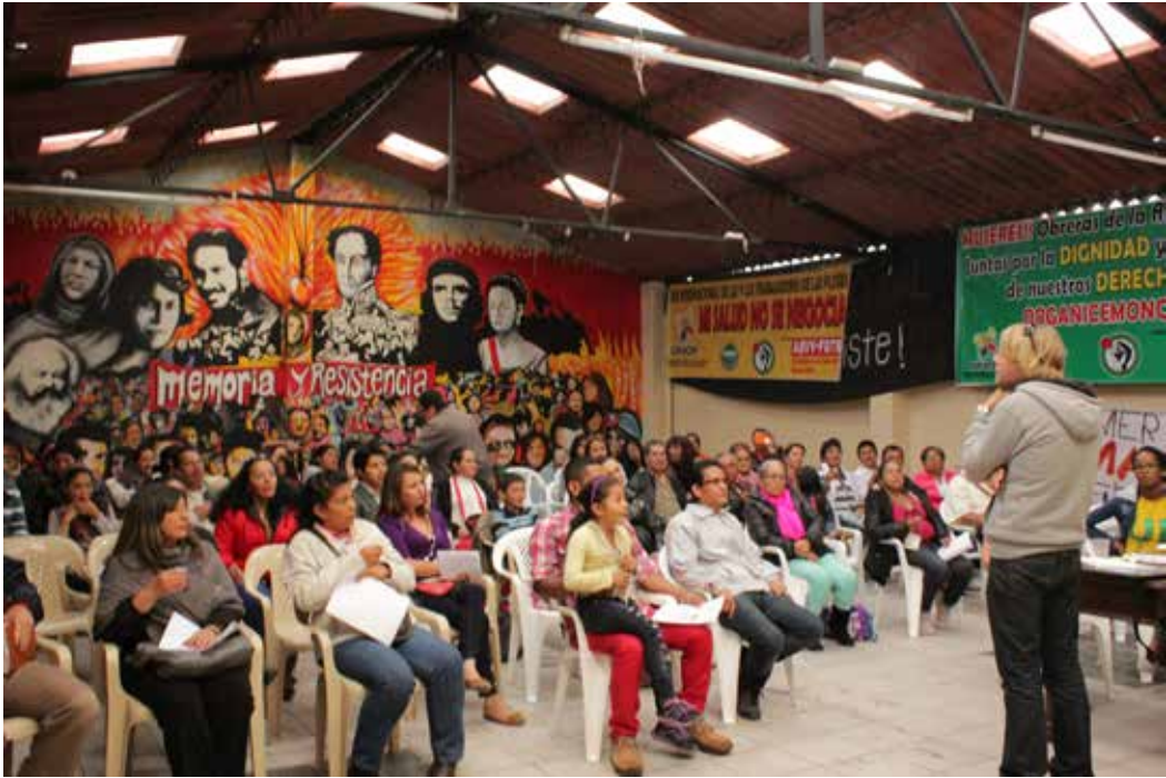
Foto: Organización Nacional de Obreros Trabajadores de la floricultura Colombiana.

A partir de entonces, el 8 de marzo queda instituido como Día Internacional de la Mujer y se celebrará con gran despliegue en todos los países de la órbita comunista, especialmente a partir de los años veinte, con el nombre de Día Internacional de la Mujer. En Occidente, serán los partidos comunistas los que convoquen a esta celebración, y de esta manera, el Día Internacional de la Mujer surge para hacer propaganda a favor de los derechos laborales de las trabajadoras y manifestación